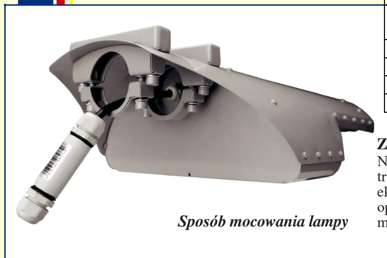
Sposób mocowania lampy