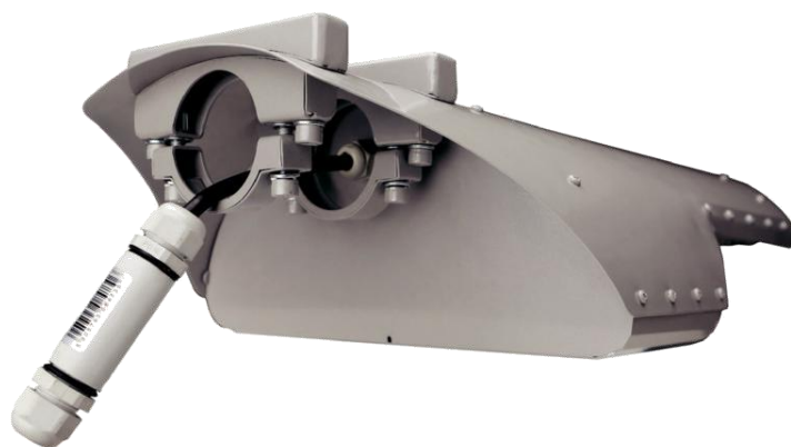
Метод монтажу лампи